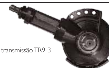
Caixa de transmissão TR9-3

Acionamento via cardã CEL 37 com sistema anti-impacto com limitador de torque, rotação da enxada rotativa de 151 a 540 rpm na TDP e/ou de 280 a 1000 rpm na TDP, caixa de transmissão centralizada modelo TR9-3